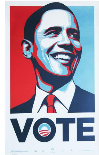
Shepard Fairey (OBEY)